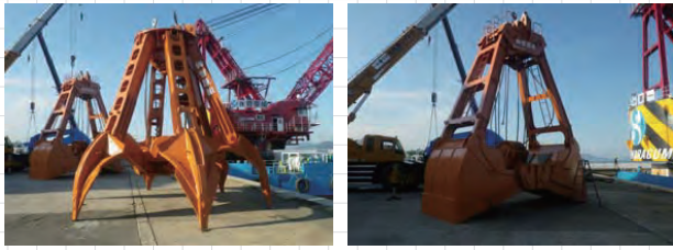
10.0m 3 オレンジバケット (30t)